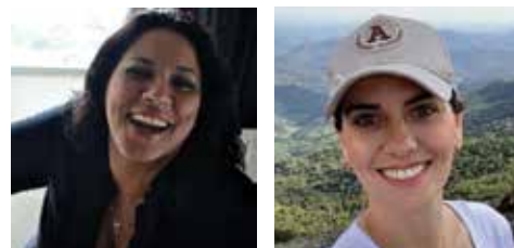
Por Simone Santos e Poliana Ferreira

Você Precisa Provar, não é apenas uma coluna com dicas de gastronomia. Queremos ir e vamos além. Deixaremos aqui nossas experiências, emoções que valem a pena serem compartilhadas. Então sejam bem vindos a mais uma edição da coluna