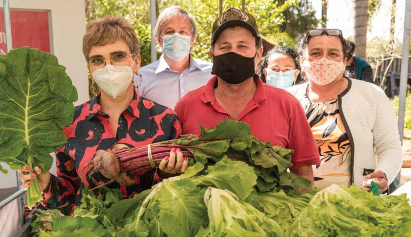
Presença de Prefeita de Contagem - Marília Campos