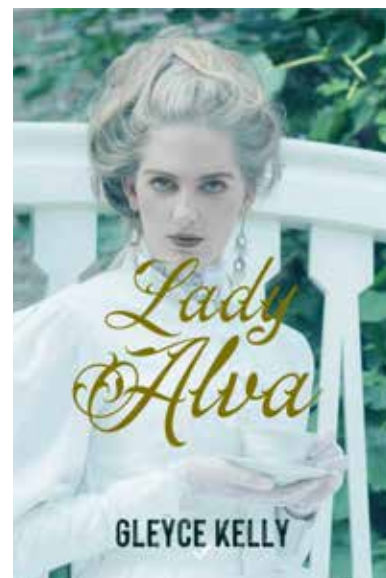
KELLY, Gleyce. Lady Alva. Minas Gerais, 2021. 1a. Edição - 2021. eBook Kindle disponível na Amazon

Enfim, se gosta de uma boa leitura, de romance, aventura, ficção científica e ação, não deixe de ler “Lady Alva”.